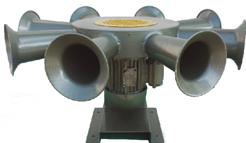
EG-109TT* à prova de explosão

A sirene EG-109 TT , utiliza motor trifásico de 3kW (HP-cv 2.2 [3.0]) com voltagem de 220/380/440, RPM de 3450 de 60Hz, com proteção IP21, IP55 e a prova de explosão conforme ABNT NBR IEC 60079-1. Composta por 8 projetores de som megafônicos uniformemente distribuídos em seu perímetro, proporcionando uma cobertura sonora em 360°. Emite um único tipo de alerta, proporcionando um longo alcance em relação ao local de instalação. Gera uma pressão sonora de aproximadamente 105dB à 30metros e 124dB à 1metro . Indicada para alertas de desastres naturais, tais como enchentes, deslizamento de terra, tempestades, etc. bem como também pode ser utilizada como alarme de incêndio. Para mais detalhes, consulte nosso site.